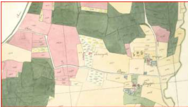
← Plan parcellaire de la commune de Moirax 1808 - 2ème feuille section D