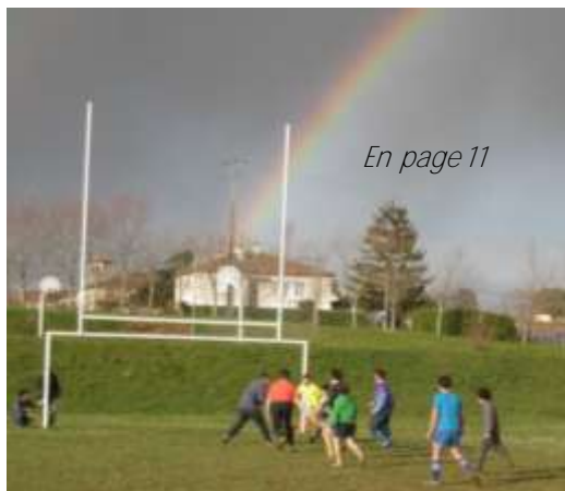
En page 11