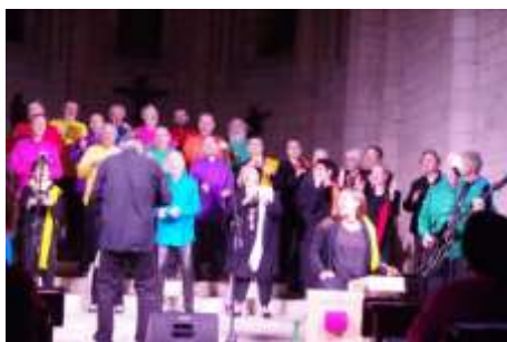
Happy Gospel Singers 50 choristes qui font ressurgir l'âme noire

Voici en quelques photos un aperçu d'une belle programmation d'arrière-saison.