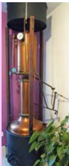
Alambic de 1906 fabriqué par Estève Bernard à Bordeaux

Même les écoliers venaient en visite, c'était pour eux une leçon de choses "live", on découvrait et on apprenait ainsi les principes physiques de l'évaporation et de la distillation.