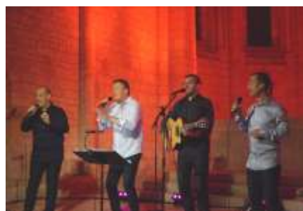
Barbara Fortuna, l'âme corse à envouté le public le 23 09 2017