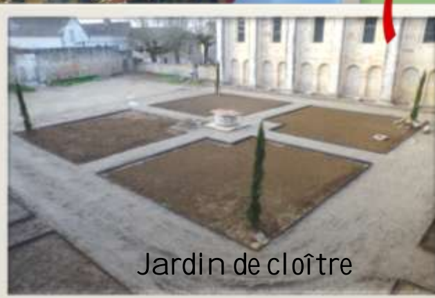
Jardin de cloître