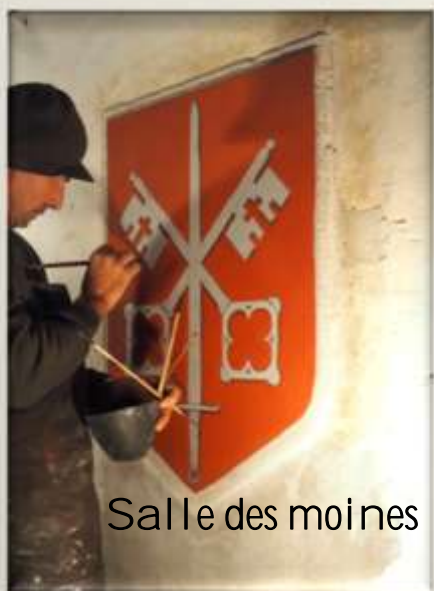
Salle des moines