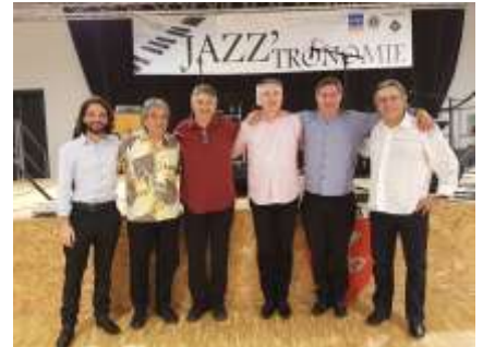
Le Lions Club d'Agen Val de Garonne

jours rempli des différents et merveilleux crus proposés. Que cette féerie puisse être renouvelée !